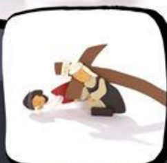
Simon iz Cirene pomaga nesti križ ...