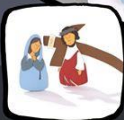
Ljuba mati ...