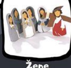
Žene, ne jokajte ...